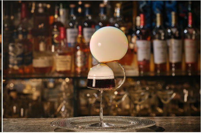
宇宙に浮かぶ小惑星をイメージしたカクテル「アステロイド」

ホテル インターコンチネンタル 東京ベイ(所在地：東京都港区海岸1丁目16番2号、総支配人：宮田 宏之)では、ハドソンラウンジ内のバー「アンバー」において、深まりゆく夜をより贅沢に愉しんでいただくため、営業時間を延長するとともに、5月1日より新たな目玉商品として2種の新作カクテル「アンバー スペシャルセレクション」を販売いたします。