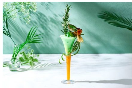
テキーラのハーバルな香りとバニラアيسのココがメロンの甘みを引き立てるシーズナルカクテル