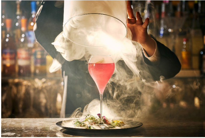
スモークとともにフローラルな香りが広がる「シークレット・ガーデン」