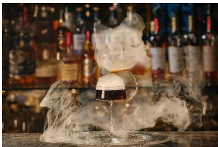
「アステロイド」のバブルが弾ける瞬間には爽やかなシトラスの香りが広がる