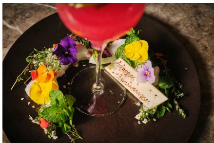
「シークレット・ガーデン」の華やかなプレートにはメッセージを添えることも可能

構成：テキーラ、メロンシロップ、メロンピューレ、バニラアイス、フレッシュメロン 飾り：メロン皮、エディブルフラワー（ピオラ）、ライム、ローズマリー、金箔、林檎