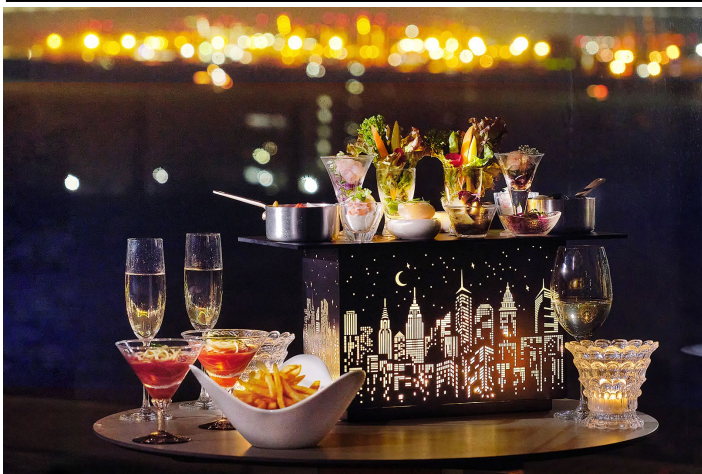
ルーフトップテラスで心地よい海風を感じながら、 シャンパンフリーフローとシェフこだわりの特製オードブルが堪能できる

販売期間: 2026年6月15日(月)～10月31日(土)まで 場所: レインボーブリッジビューダイニング&シャンパンバー マンハッタン