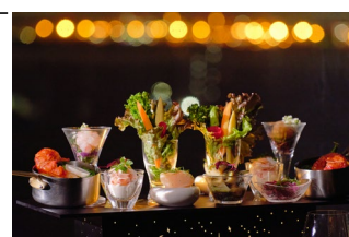
Manhattan Nights Stand オードブル(イメージ)