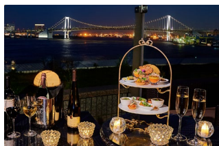
ジュエリースタンドオードブル (イメージ)