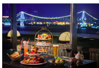
トワイライトビアテラス料理(イメージ)

ポークリエット、チーズグリッシーニ、オニオンキッシュ、季節のテリーヌ、 スモークサーモン、ツブ貝のコンフィ ブルギニオン風、野菜のブラマンジェ