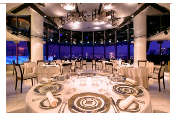
マンハッタン内観

1990年生まれ・神奈川県出身。母親の実家が蕎麦屋だったバックボーンを持ち、物心が付いた頃からお客様が喜んでいる様子を見て嬉しく感じることや、家族に料理を作った際に喜んでもらった経験から、将来は料理人を目指したいという気持ちが芽生える。さらに、外食する機会の中でフランス料理の華やかさやシェフのcocktail姿に憧れ、ホテルのフランス料理に進む。2013年4月日本大学 生物資源科学部 食品生命学科卒業後、ホテル インターコンチネンタル 東京ベイに入社。フレンチレストラン「ファインダイニング ラプロヴァンス」にてフランス料理の基礎を学ぶ。2023年9月にレインボーブリッジビューダイニング&シャンパンバー マンハッタンの料理長に就任。お客様に喜んでいただくことを一番に考え、味、彩り、コースのバランスを考えながら日々料理に向き合う。ここでしか味わえない料理の創作と提供することを常に心がけ、再び訪れたくなるようなお店づくりを目指している。