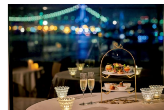
ダイニング内のお席(イメージ)