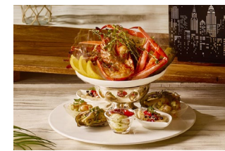
7種の海鮮メニュー(イメージ)