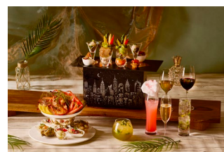
豪華なシーフードセレクションが付く 新プラン(イメージ)