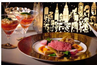
ボリュームのある グリルステーキ付きプラン(イメージ)