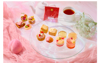
テイクアウト アフタヌーンティーBOX (イメージ)