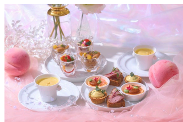
桃をアクセントにした全6種のセイボリーを ラ・プロヴァンスよりお届け