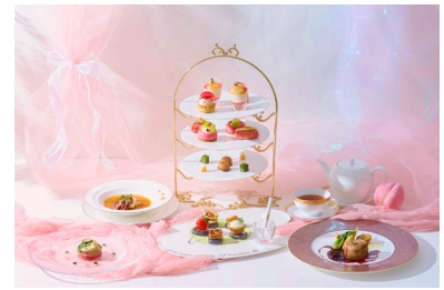
ラ・プロヴァンス アフタヌーンティースタイル デザート付きコース(イメージ)