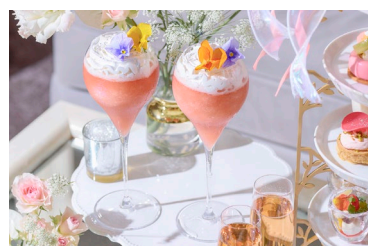
スペシャルモクテル (ニューヨーククラウンジ限定)