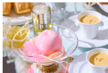
艶やかな桃型のムースにグラニテを添えた スペシャルティッシュ