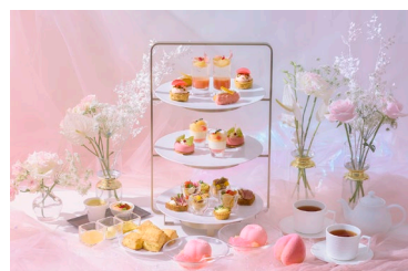
ハドソンクラウンジアフタヌーンティー