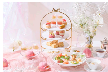
パレットアフタヌーンティー (マンハッタン)