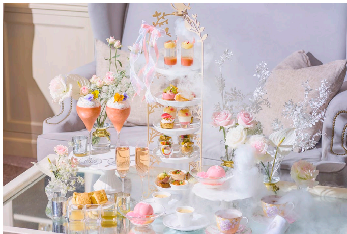
暑い夏でも軽やかに食べられるスイーツと涼やかなドライアイス演出をご用意

ホテル インターコンチネンタル 東京ベイ(所在地：東京都港区海岸1丁目16番2号、総支配人：宮田 宏之)では、ニューヨーククラウンジなどの5店舗とインルームダイニングにて、桃を主役に雲の上に広がる幻想的な世界をイメージした「ピーチブランシュアフタヌーンティー」を7月1日より期間限定で提供いたします。また、N.Y.ラウンジブティックでは、一部アイテムをBOXに詰め合わせたテイクアウトのアフタヌーンティーを販売いたします。