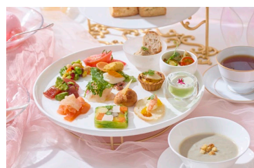
セイボリーは約14種から ビュッフェスタイルで選べる (マンハッタン)