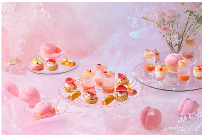
雲の上に広がる幻想的な世界をイメージした、桃が主役のアフタヌーンティー

場所：ニューヨーククラウンジ、他4店舗、インルームダイニング、N.Y.ラウンジブティック