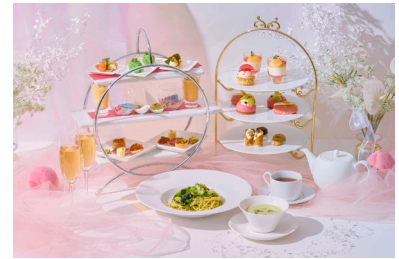
イタリアンダイニング ジリオン アフタヌーンティースタイル デザート付きコース(イメージ)

前菜5種盛り合わせ、スープ、パスタ、メインディッシュ、アフタヌーンティースタイルデザート(同上)