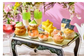
夏の三大フルーツが主役の スイーツ