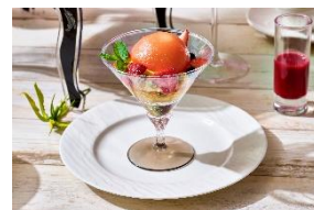
オプションデザート ピーチメルバパフェ