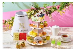
テイクアウトアフタヌーンティー