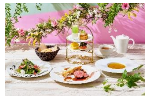
ミニアフタヌーンティー付きコース