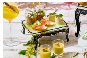
ポリューム満点セイポリー4種