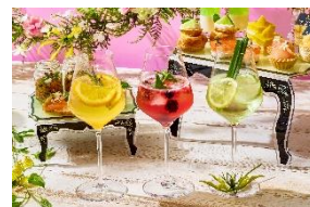
ティオプシヨンドリンク ボタニカルフルーツジントニック