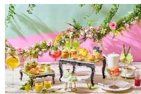
ボタニカルサマーフルーツ アフタヌーンティー