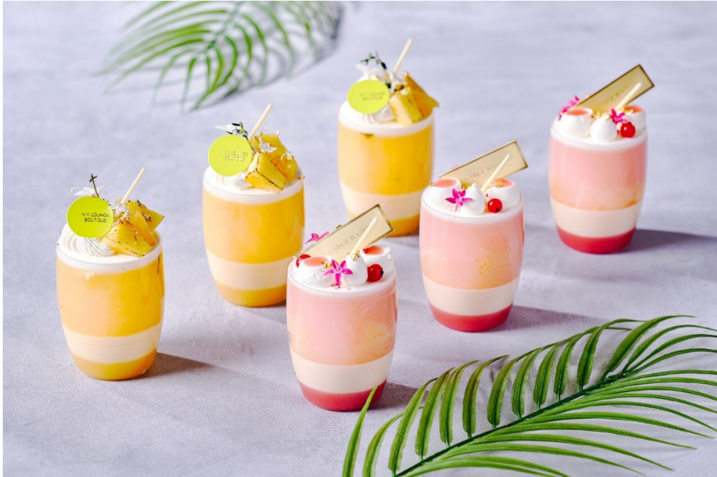
夏の定番カクテル「モヒート」と世界のトップバーで愛される「ジン・バジル・スマッシュ」をアレンジした爽やかなゼリーが登場

販売期間：2026年6月1日(月)～9月30日(水) 場所：ザ・ショップ N.Y.ラウンジブティック