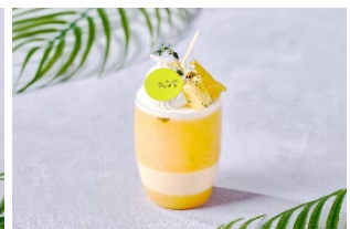
ボタニカル パイン