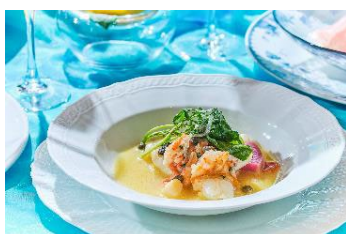
魚介類のアクアパッツァ