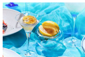
レモンを使用した涼やかなデザート