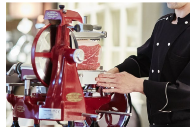
食べ放題の生ハムは目の前でカッティング