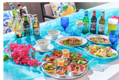
充実したフリーフローメニュー