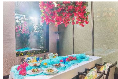
ブーゲンビリアに包まれた個室空間 花言葉は「永遠の愛」