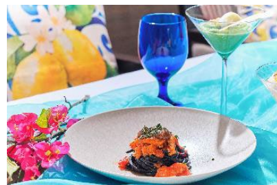
ズッキーニとグリーンピースのピュレと 自家製タリオリーニ・ネロ