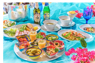
納涼会やご友人との賑やかな集いにおすすめ