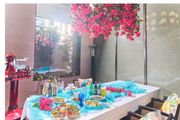
1日2組限定の特別装飾席

https://www.interconti-tokyo.com/zillion/plan/zillion-amalfi_2026.html