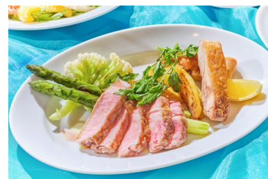
ポーク&チキン盛り合わせ