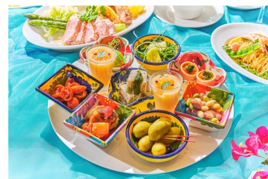
彩り豊かなタパスが10種類