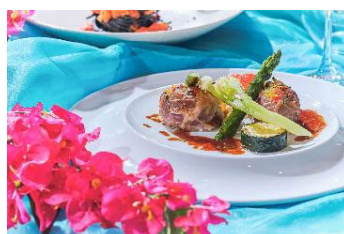
羊ロース肉と夏野菜のクレピネット焼き