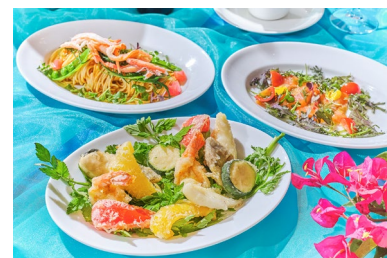
旬の夏食材を取り入れた料理