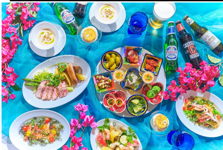
生ビール2種、イタリアンビール3種飲み放題付きの賑やかなビアプラン

期間：2026年7月1日(水)~9月13日(日) 場所：イタリアンダイニング ジリオン