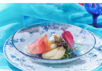
プルータチーズと桃のインサラータ