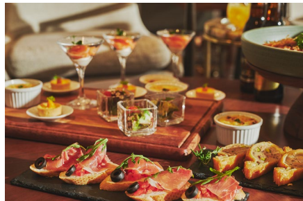
フレンチやイタリアンをベースにアレンジした 彩り溢れる前菜