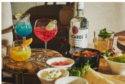
バカルディと相性のよいタコス、 ホテルオリジナルモクテル3種