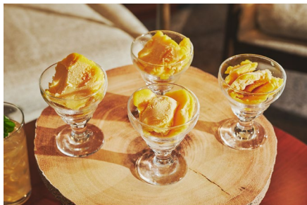
デザートはさっぱりとした味わいの マンゴーアイスクリーム