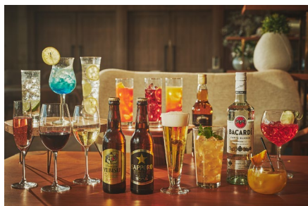
ビールをはじめ、レモンサワー、 スパークリングワイン、スタンダードカクテルなど約40種