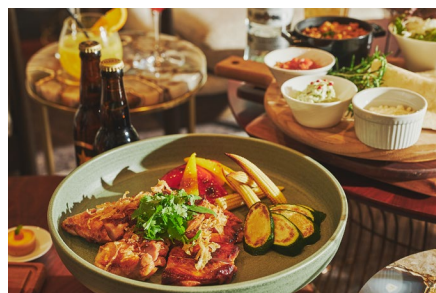
メインディッシュは、 コリアンダー香るアジアン風チキンソテー