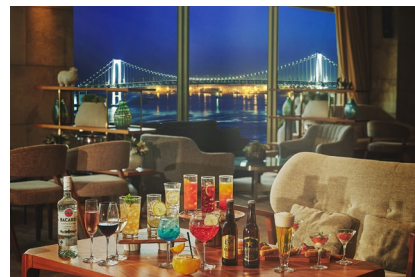
窓一面に広がるベイビューと 上質なフリーフローアイテム

https://www.interconti-tokyo.com/banquet/plan/premium-beer-lounge_2026.html