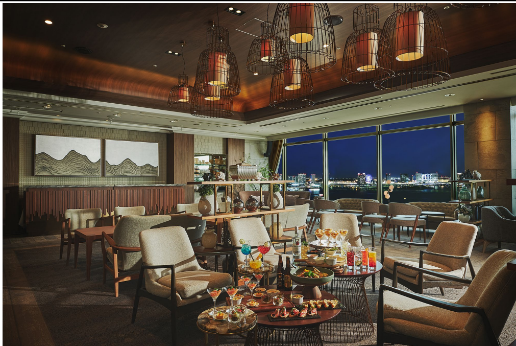
ゆったりと寛げる貸し切りのラウンジ空間で、東京湾の美しい夜景とともに 彩り豊かなパーティーメニューとフリーフローを楽しめるプレミアムビアラウンジ～Baysidenight～

期間: 2026年7月13日(月)～9月30日(水) 場所: 5階/タイムネスト