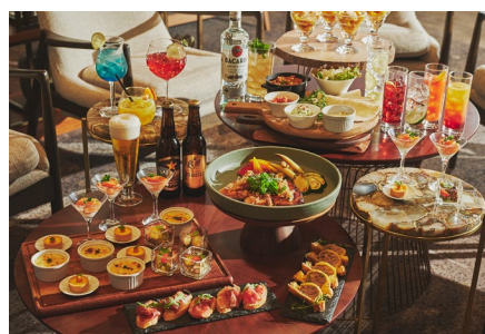
ビールやワインと相性の良い バラエティ豊かなパーティーメニュー