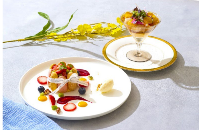
お子様に向けて、親子で本格的なフランス料理作り体験を楽しみながら「食」への興味関心を育む、クッキングイベントを開催