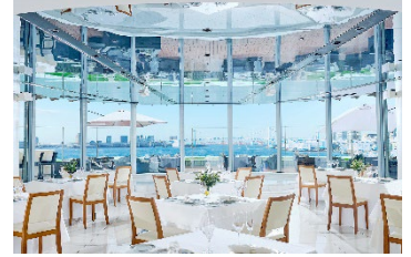
マンハッタン内観

レインボーブリッジなどの東京湾岸の眺望をお楽しみいただけるレストラン。ランチタイムは、シェフ厳選の冷前菜・焼きたてパン・スイーツをbuffetスタイルでお楽しみいただけます。メインディッシュをお選びいただける「マンハッタン シェフズセレクション プリフィックスbuffet」をご堪能いただけます。ディナータイムは、〈N.Y.グリルフレンチ〉のコーススタイルを提供するダイニングエリアと、〈シャンパンバー〉のテラスエリアをご用意しております。フランス料理をベースにした、本場ニューヨークのグリル料理の文化「熟成」を取り入れたスタイルをお楽しみいただけます。