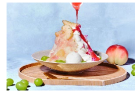
白桃と山梨県産シャインマスカットの プレミアムかき氷

https://www.interconti-tokyo.com/dining/plan/premium-shaved-ice_2026.html