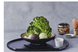
特選狭山抹茶のプレミアムかき氷