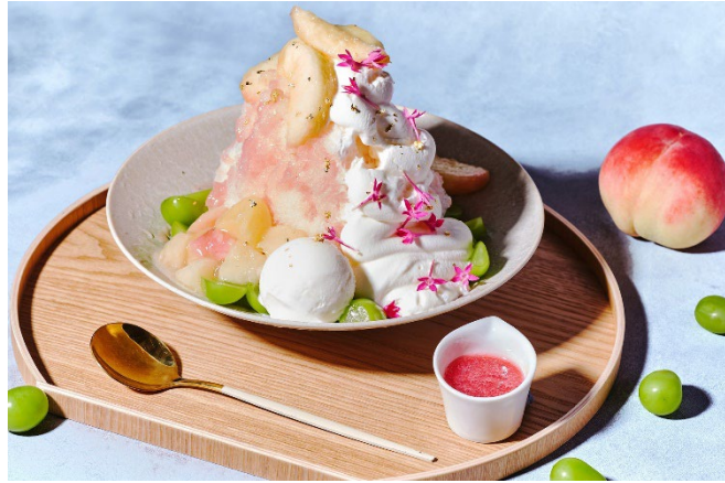
丸ごと一玉分の白桃と山梨県産シャインマスカットを 贅沢に味わうプレミアムかき氷

販売期間：2026年7月17日(金)～9月30日(水) 場所：ニューヨーククラウンジ、ハドソンクラウンジ