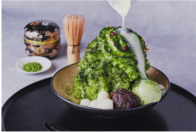
農林水産大臣賞をはじめ国内外で高い評価を受ける「狭山銘茶 丸康園」の 特選狭山抹茶を使用したプレミアムかき氷