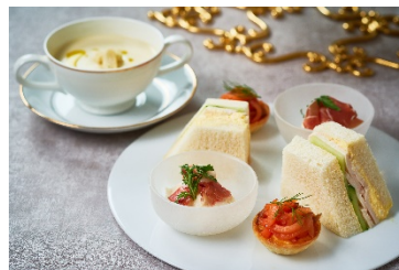
冬の味覚を演出するフレンチレストランで 作られる本格セイボリー

[添付資料] 店舗紹介、新型コロナウイルス感染症への当ホテルの取り組みについて、インターコンチネンタルホテルズ & リゾーツについて