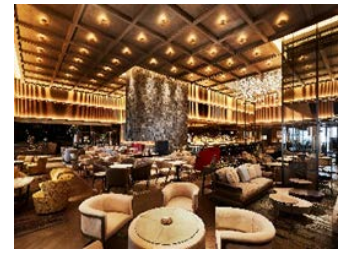
ハドソンラウンジ 内観

2020年6月27日グランドオープン「逢う・集う・囲む」をコンセプトにした開放的かつダイナミックなラウンジ&バー。天井高5mの「火を囲む暖炉のあるラウンジ」を空間の中心とし、7mのカウンターを備え、光と影が演出するアーティスティックで魅惑的なバーエリア「アンバー」と、ソファ席や洛中洛外図を設置したラウンジエリア、ライブラリーの落ち着いた雰囲気醸し出すエリア「ザ ライブラリー」、会食や接待、ミーティングにもご利用いただけるプライベートルーム「ライト」「エジソン」を完備した、人と人の交わる、当ホテルの新たなシンボルラウンジです。