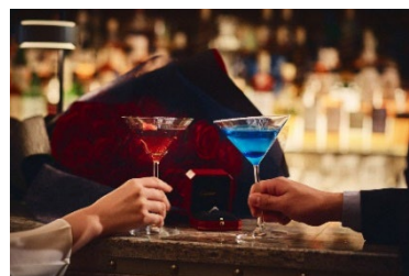
お二人の大切な記念日に特製カクテルをご用意。