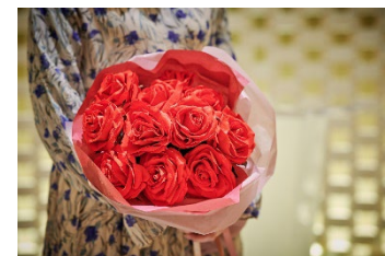
「最愛」「宝物」「大切にしたいもの」という意味が含まれる11本の赤バラをご用意。

料理(ルームサービス)/メッセージ付ホールケーキ/ お祝いのお花「プティ・ブーケ」/記念写真/スイーツギフト