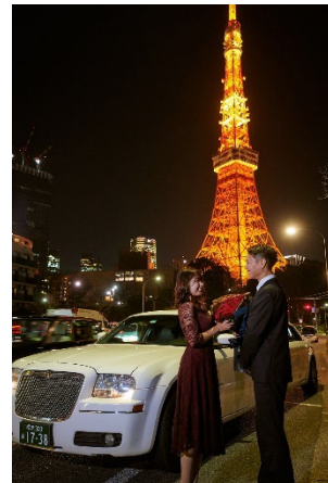
リムジンで東京タワーや夜景の綺麗なスポットを巡って、記念写真を撮影。

【プラン特典】スイートルーム確約／写真館で記念写真撮影／ ＜ラ・プロヴァンス＞乾杯酒付きスペシャルディナーコース(18:00-20:00)／ リムジンツアー(20:00-21:00)／お部屋にバルーン装飾と花束のご用意