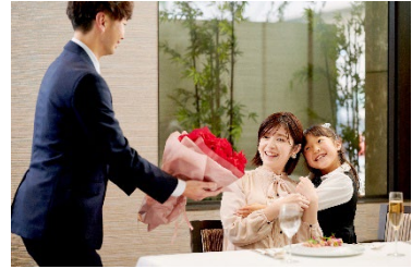
愛する人に日頃の感謝の気持ちを込めて花束をご用意。

【プラン特典】グラスシャンパン(お一人様1杯) / 赤バラ(11本)花束(1予約1点) / メッセージ付 デザートプレート / 記念写真