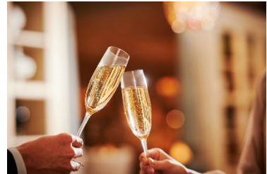
乾杯酒で記念日の特別感を演出。

【プラン特典】グラスシャンパン(お一人様1杯) / 赤バラ(11本)花束(1予約1点) / メッセージ付 デザートプレート / 記念写真