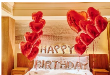
サプライズのバルーン装飾で忘れられない一日に演出(イメージ)。