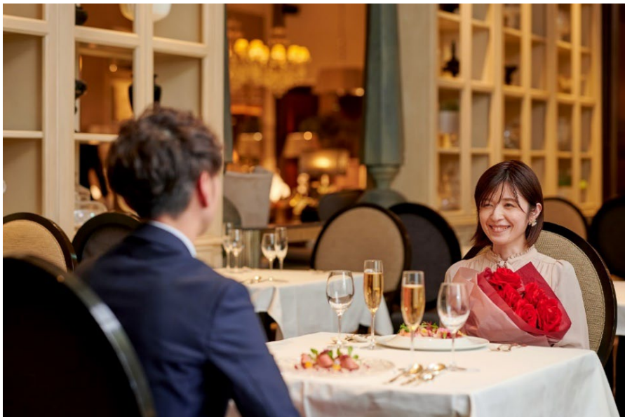
永遠の愛を誓った特別な日に、様々な特典付きの結婚記念日ランチ&ディナープランをご用意。