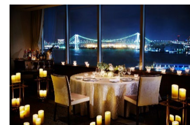
リラックスできる空間でゆったり食事を楽しみいただける個室プランもご用意。

【プラン特典】グラスシャンパン(お一人様1杯) / 赤バラ(11本)花束(1予約1点) / メッセージ付き アニバーサリーケーキ / 記念写真