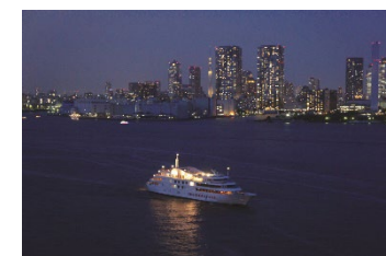
東京の夜景に包まれるクルージング付ステイプランで特別な結婚記念日を過ごすことができる。