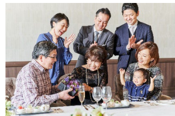
シーンに応じて選べるさまざまな個室をご用意。