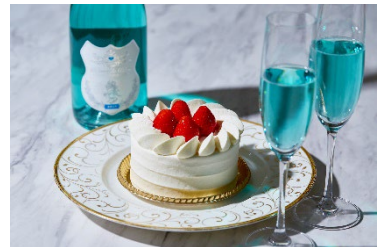
シェフズ ライブ キッチンで、ブルースパークリングワインとホールケーキ付きプランをご提供。

【プラン特典】グラスシャンパン(お一人様1杯) / 赤バラ(11本)花束(1予約1点) / メッセージ付 デザートプレート / 記念写真