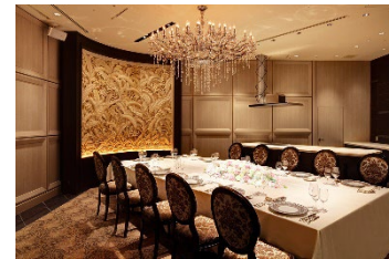
プライベートな空間で食事を楽しむことができる。