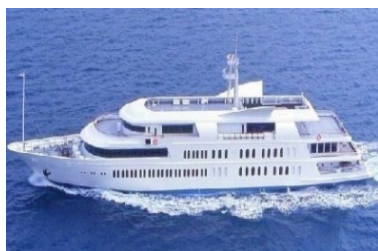
東京湾の多彩な表情を味わえるディナークルーズ付ステイプランをご提供。