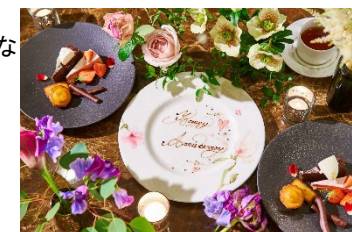
メッセージ付のデザートプレート (イメージ)