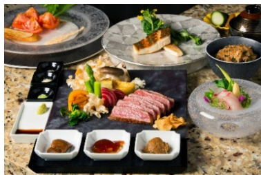
贅沢な和牛鉄板焼コース(イメージ)。

【プラン特典】スイートルーム確約／ハドソンラウンジにてカクテルタイム(1時間)／ 「ディナークルーズ」19:00～21:30(乗船時間約90分)／写真館で記念写真撮影／お部屋に花束のご用意