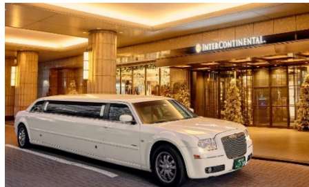
リムジンでロマンチックな夜景を眺めながら二人きりの時間を存分に楽しめる。