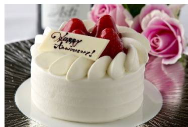
お祝いに欠かせないメッセージ添えのアニバーサリーケーキ(イメージ)。