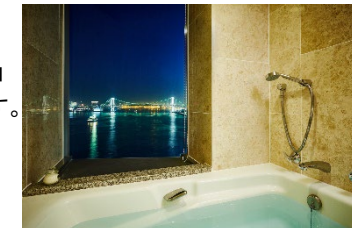
バスルームから夜景を眺めながら特別なひとときを。