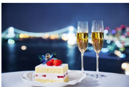
クリスマスケーキとスパークリングワイン(イメージ)