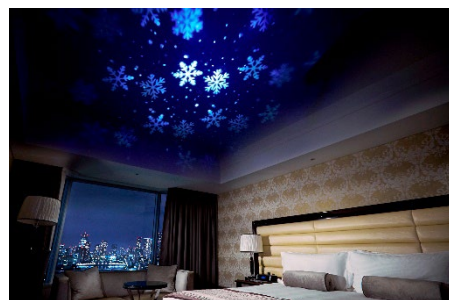
幻想的な雪の結晶が天井に映し出されるスノーホワイトルーム(イメージ)

※インルームダイニングよりデラックスブレックファストをお部屋までお届けいたします。