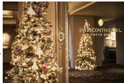
ホテル館内がクリスマス仕様に

https://www.interconti-tokyo.com/stay/plan/christmas.html