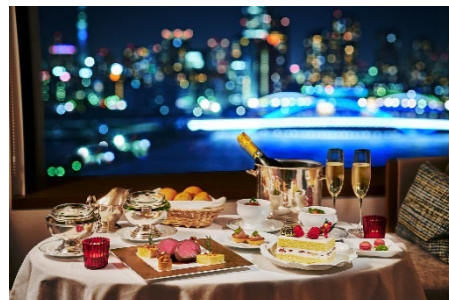
インルームダイニングのスペシャルディナーでお二人だけの時間を過ごせる