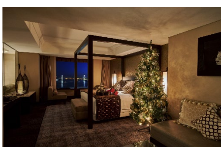
デザイナーズスイート&ルームは4タイプを揃え、クリスマスツリーで華やかな空間を演出(写真はラグジュアリーオリエンタル)