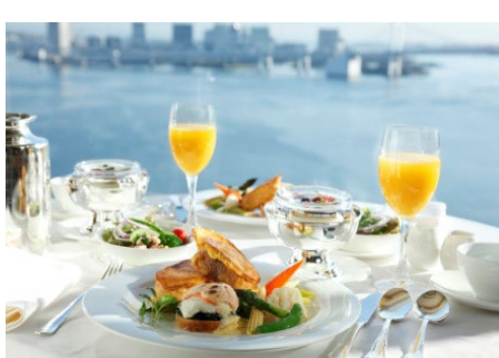
デラックスブレックファスト(イメージ)