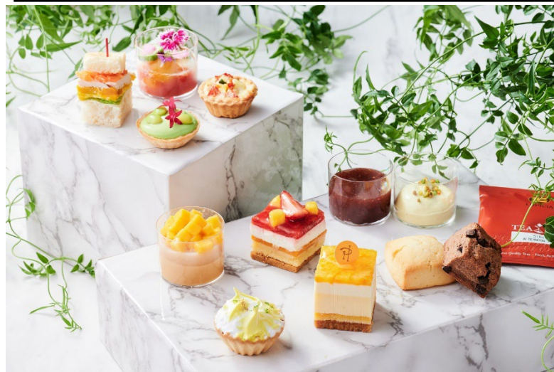
ピエール・エルメ・パリのプティ・ガトーなどを詰め合わせた 贅沢なテイクアウトアフタヌーンティーが登場

期間:2023年6月1日(木)～8月31日(木) 場所:ザ・ショップ N.Y.ラウンジブティック