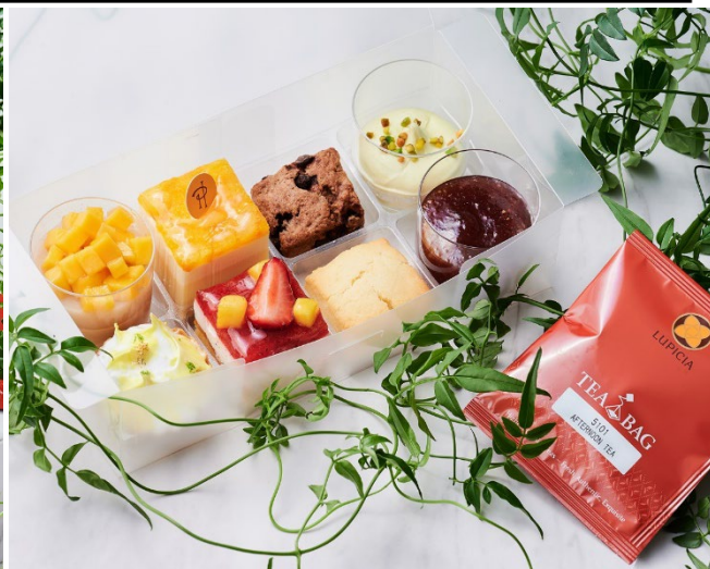
プティ・ガトーとスコーンのみを揃えたプティフルセット

ホテル インターコンチネンタル 東京ベイ(所在地:東京都港区海岸1丁目16番2号、総支配人:宮田 宏之)では、ザ・ショップ N.Y.ラウンジブティックにて、マンゴー、パッションフルーツやライチなどのサマーフルーツをふんだんに使ったピエール・エルメ・パリのプティ・ガトーなどをラインナップしたテイクアウトアフタヌーンティーを期間限定で販売いたします。