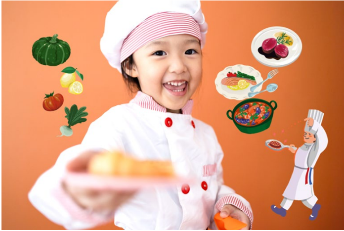
お子様に向けて、親子で本格的なフランス料理作り体験を楽しみながら、「食」への興味を高めるクッキング教室イベントを開催

開催日: 8月25日(金) 場所: 宴会場「ハーバービューテラス」/3階 主催: ダイナースクラブ フランス レストランウィーク事務局