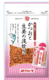
「かつおと生姜の浅炊き」