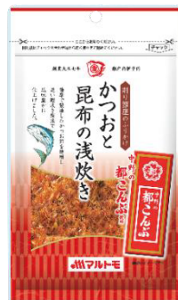
「かつおと昆布の浅炊き」