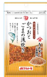
「かつおとごまの浅炊き」