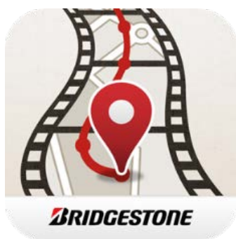
「Drive Link」アプリアイコンイメージ

本アプリは、友達や家族などと一緒に出かけるドライブの思い出を一つのストーリーとして残し、手軽に共有することをコンセプトにしています。全員が撮影した、立ち寄った場所での写真・コメント・位置情報を一つにまとめ、豊富なテーマ (テンプレート) と BGM を使って手軽に動画作成ができます。また、作成した動画やメンバーが撮影した写真は、SNS でシェアすることも可能です。