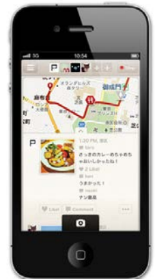
操作画面イメージ

あなた（またはあなたと友人グループ）が移動したルートをマップ上に記録することができます。写真を撮影した場所には、「グルメ」「人」「風景」など、写真の種類に合わせてピンを選んで立たせることができるなど、一連のドライブの思い出をマップとして残すことができます。