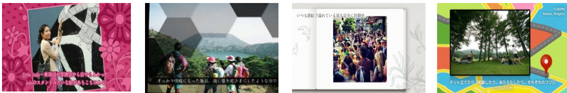
テーマ（テンプレート）イメージ

5つのテーマ・計20種類のテンプレートと音楽を組み合わせ、500種類以上のバリエーションから気分やシチュエーションに合わせて動画を手軽に作成することができます。(テーマの種類: Standard、Soft、Pop、Cool、Active)