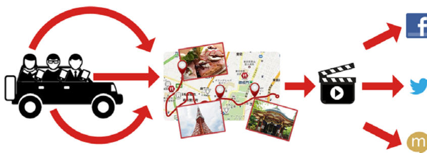
全員の撮影した写真からムービーを作り、共有するイメージ図