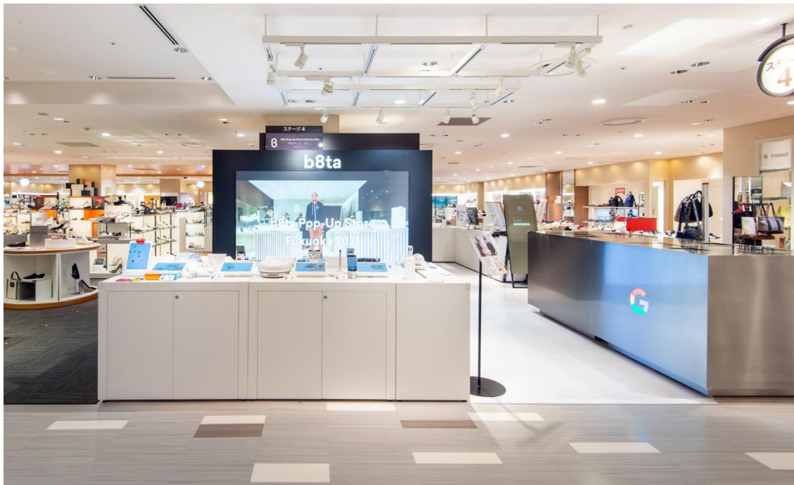
b8ta Pop-Up Hakata Hankyu

オープンを記念し、各地ブランドの東京進出を応援するため、4ヶ月間の出品料金が最大で半額割引になるプラン「Go with b8ta」を期間限定で提供開始いたします。