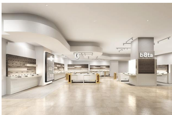
b8ta Tokyo - Shinjuku Marui 店舗イメージ

「感染症の世界的拡大という不測の事態が継続する中、b8taを2店舗同時に東京で開業できる喜びをかみしめています。開業にあたっては、感染症の感染予防・拡大防止対策を徹底し、お客様に安心してb8taを通じて“新たな発見”を体験いただけるようスタッフ一同準備を進めて参ります。皆さまをお招きできる日を今から楽しみにしております。」