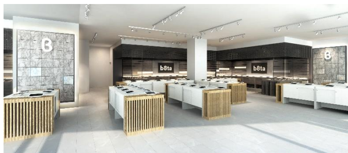
b8ta Tokyo - Yurakucho 店舗イメージ