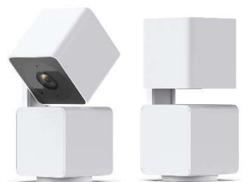
垂直方向 180°回転（チルト）