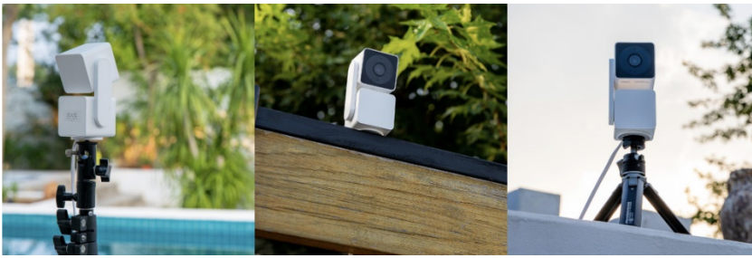
三脚ネジ方式のブラケット（市販品）を利用した外壁取り付けイメージ