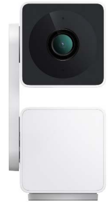
ATOM Cam Swing

(3) モードを選択しない状態はマニュアルモードとなり、アプリ画面の十字キー操作によってカメラをどの方向に向けてでも自在に動かせ、次に動かすまでは最後に止めた位置で固定されます。