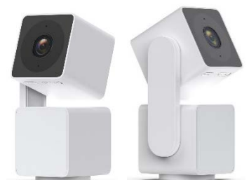
水平方向 360°回転（パン）