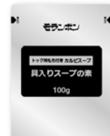
具入りスープの素 100g