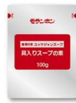
具入りスープの素 100g