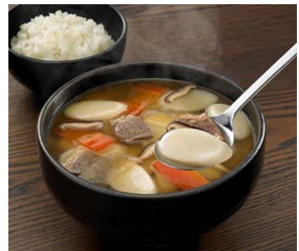
(カルビスープ 調理例)