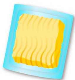
ラーメン (フライ麺)