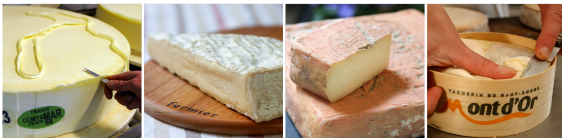
左からコンテ、ブリ・ド・モー、タレツジョ、モンドール

ペアリングセットに同梱されているチーズの共創パートナーであるフェルミエのナチュラルチーズは、ミシュランの星つきレストランでも提供されています。ブランド名は、フランス語で「手作りの」を意味し、生産者たちを訪ねてチーズの背景にあるストーリーを丁寧に紹介していくのをミッションとして掲げています。今回は、お酒とのペアリング知識が豊富なフェルミエの担当者から「ルビーレッドエール」に最適なチーズの組み合わせを提案いただきました。