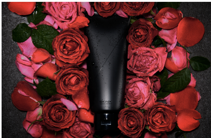
SKIN X ザ・リムーバークリーム

MOON-X株式会社（本社:目黒区、代表:長谷川 晋）のメンズスキンケアブランド『SKIN X』は、本日より楽天市場とAmazonにて、除毛クリーム「SKIN X ザ・リムーバークリームキット」の一般販売を開始いたします。本製品は、CAMPFIRE上でプロジェクトを発足し、9月6日～9月30日の25日間でクラウドファンディングを実施しました。その結果、総勢274名の支援者の方々から総額約130万円のご支援を賜り、達成率は1300%を記録いたしました。リターンは先週より随時発送しております。応援して下さった全ての皆様にお礼申し上げます。