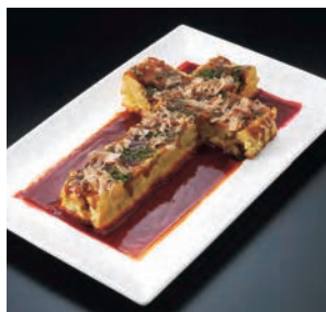
【鮮血の十字架焼き(お好み焼き)】 714円