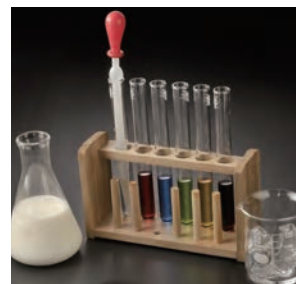
【人体実験カクテル】 924円

本件に関するお客さまからのお問い合わせ先 本件に関する報道関係者さまのお問い合わせ先 株式会社パートナーズダイニング 宣伝部：根本・瀬戸・設楽 TEL：03-5332-6231 FAX：03-5332-6301 MAIL：y.nemoto@partners-dining.co.jp