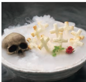
【墓場のクロスティーニ】 577円