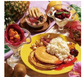
★Hawaiian パンケーキ 1,200円