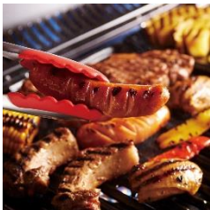
★BBQお肉セット各種 1,600～2,000円