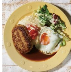
オリジナルロコモコ 800円