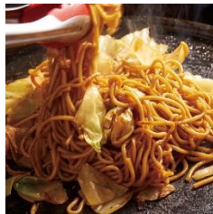
★フルーツソース焼きそば 700円