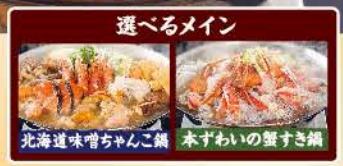
北海道味噌ちゃんこ鍋 本ずわいの蟹すき鍋