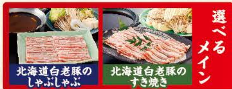
北海道白老豚のしゃぶしゃぶ 北海道白老豚のすき焼き