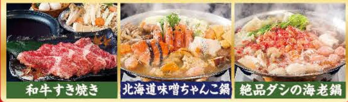
和牛すき焼き 北海道味噌ちゃんこ鍋 絶品ダシの海老鍋