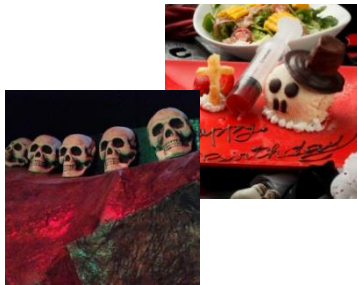
【メニュー一例】 ※価格は税別

『全国監獄化計画』と称し全国展開を仕掛けている監獄レストラン「ザ・ロックアップ」。誕生日・送別会等で一風変わったサプライズパーティーを目的とした記念日需要はもちろんのこと、合コン・デート・同窓会等でもアミューズメント要素に重きを置いたご宴会需要で、飲食店選びにおいては他のお店とは利用動機も異なります。ただ食事をするだけでなく遊べるレストランとして、今後も若者の集まる地域に出店予定です。