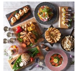
パーティーコース ¥2,780～