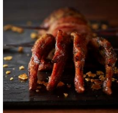
ハ・ブチキン悪魔の左手 ¥990～