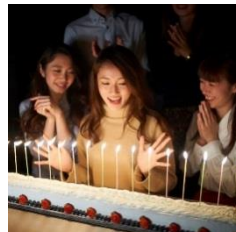
記念日ロングケーキイメージ