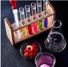
オリジナルカクテル ¥550～