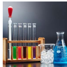
人気のオリジナルカクテル