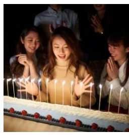
記念日サプライズ承ります