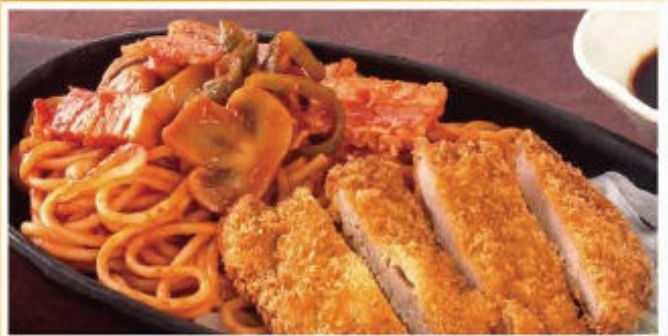
おつまみ スパカツナポリタン