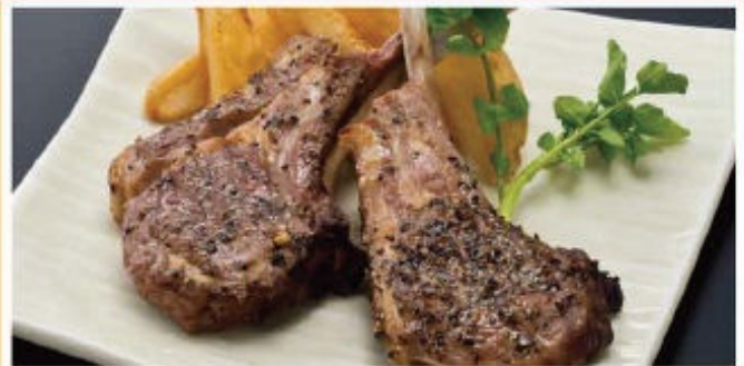
骨付ラムの黒胡椒焼き