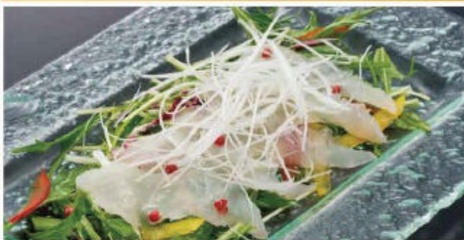
ヒラメのカルパッチョ