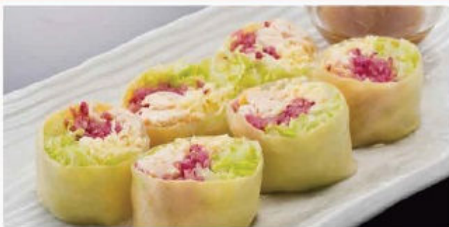
生春巻き 青しそソース