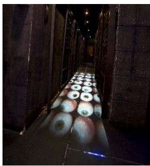
床に広がる無数の目玉を踏みながらお席まで。