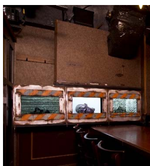
個室の奥には怪しいボックス。手前がスクリーンになっていて、砂嵐から、突如、虫が這ったり、無数の手が伸びたり…