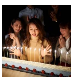
記念日サプライズ承ります