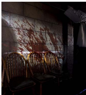
壁には突然、血しぶきが！