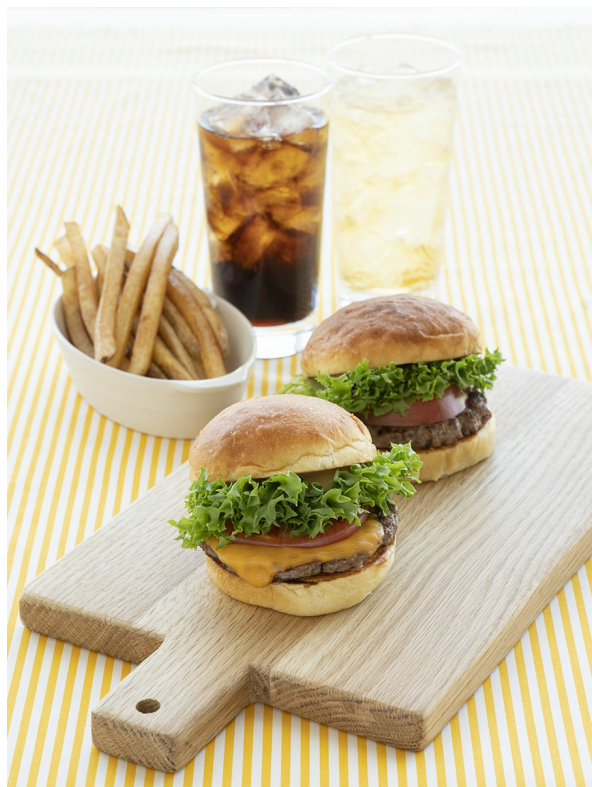
ニュータイプのハンバーガーショップ「BEX BURGER」