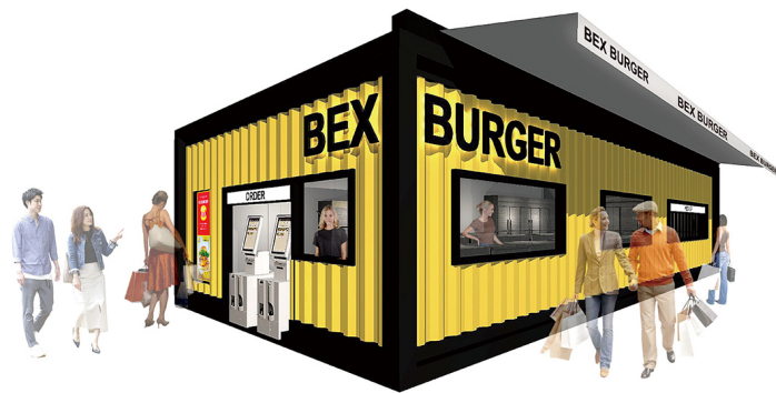
コンテナ型店舗イメージ

BEX BURGERの『コンテナ型店舗』1号店は、2021年10月に開業予定です。