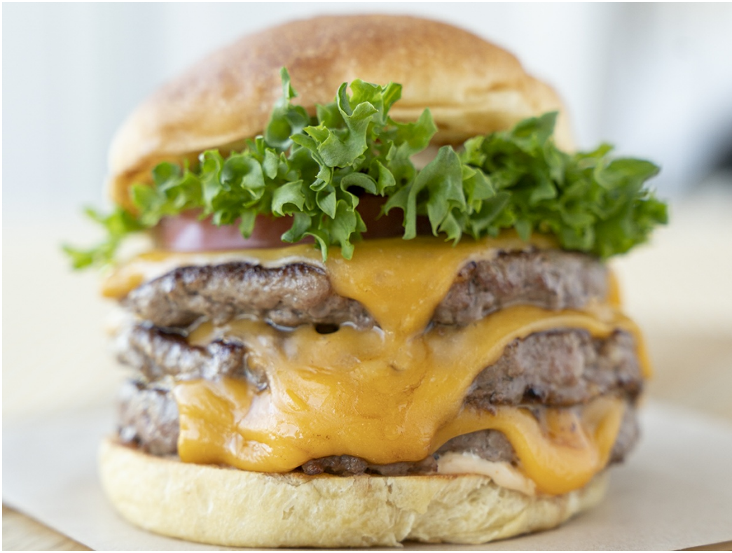
ファストフードだけどグルメバーガーのクオリティ