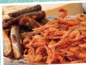
南知多産 小海老の唐揚げ