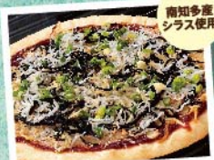
南知多産 シラス使用