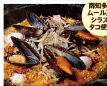
南知多産 ムール貝・ シラス・ タコ使用