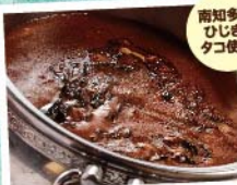
南知多産 ひじき・ タコ使用