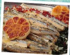
南知多産 サヨリのオイルサーデン