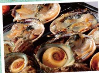
南知多産 サザエつぼ焼き