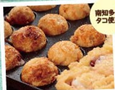
南知多産 タコ使用