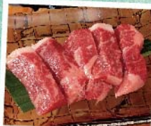
知多牛 サーロインステーキ