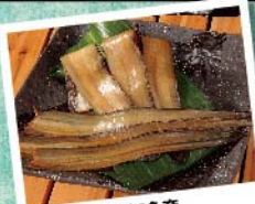
南知多産 穴子一夜干し