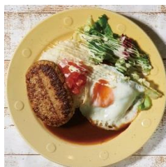
オリジナルロコモコ 800円