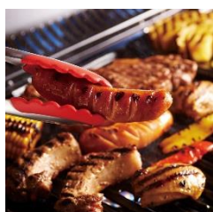
★BBQお肉セット各種 1,600～2,000円