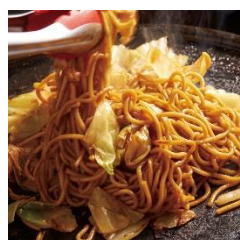
★フルーツソース焼きそば 700円