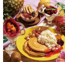
★Hawaiian パンケーキ 1,200円