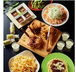
パーティーコース ¥2980～