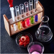
オリジナルカクテル ¥590～