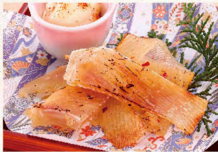
エイヒレ炙り焼き