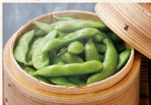
国産枝豆蒸籠蒸し