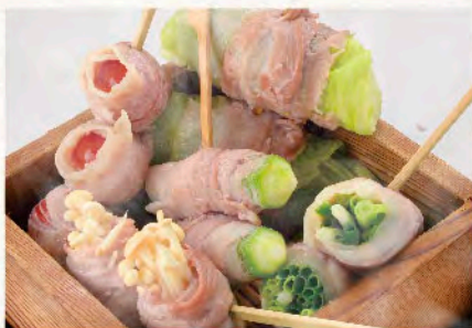
蒸籠蒸し肉巻き野菜5種