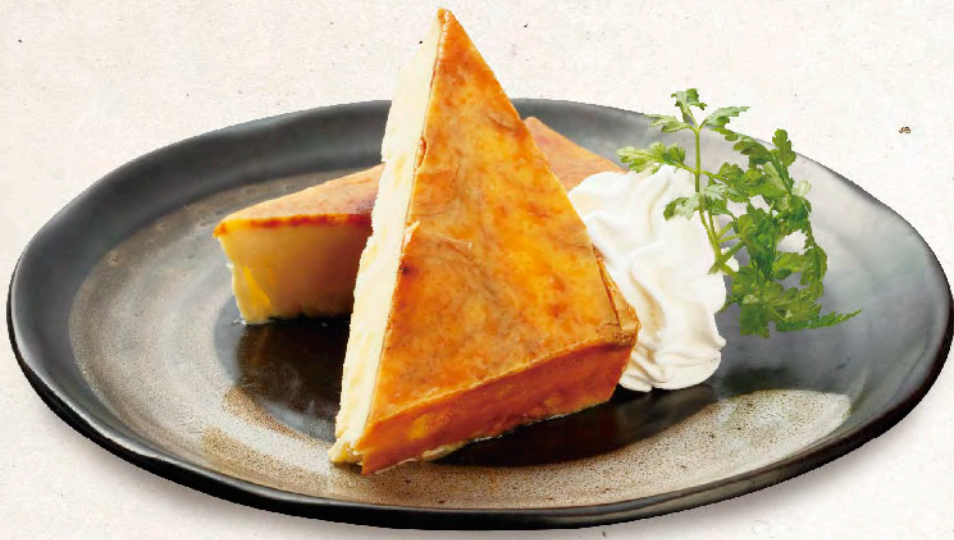
花畑牧場カタラーナ