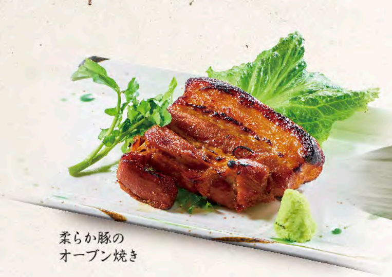
柔らか豚の オープン焼き