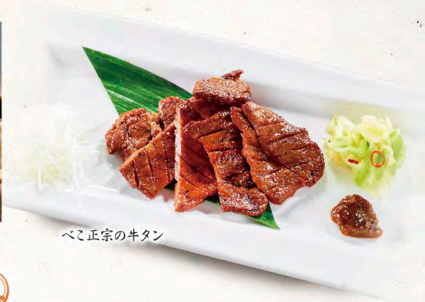
べこ正宗の牛タン