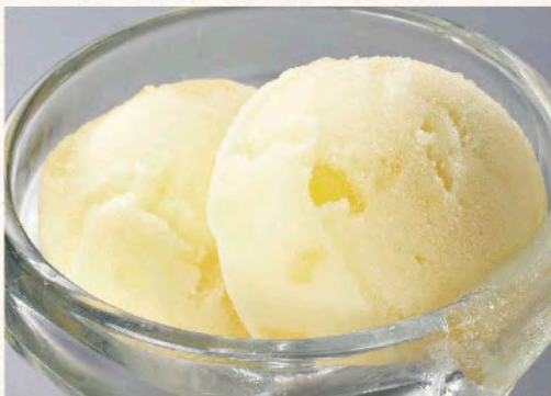
季節のシャーベット