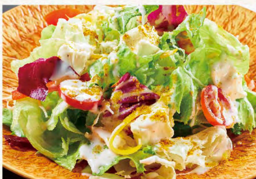
北海道産クリームチーズのシーザーサラダ