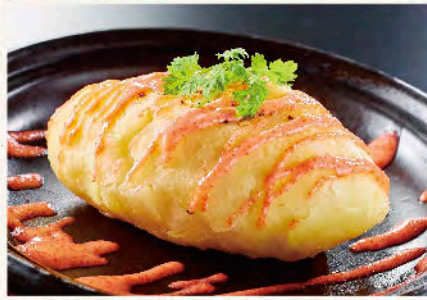
メイクインの明太じゃがバター