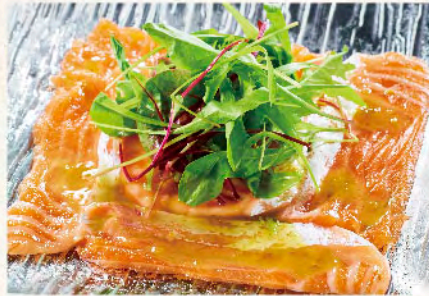
サーモンカルパッチョ