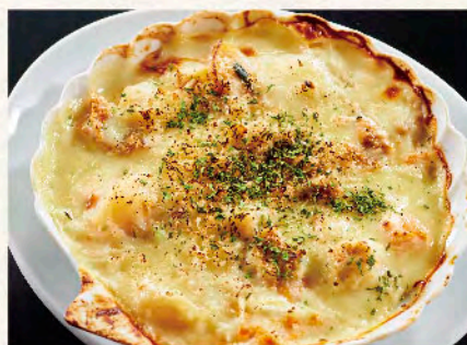
帆立味噌グラタン