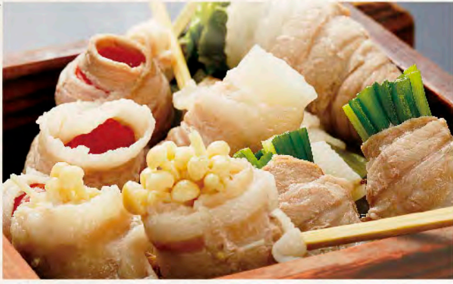
蒸籠蒸し肉巻き野菜5種