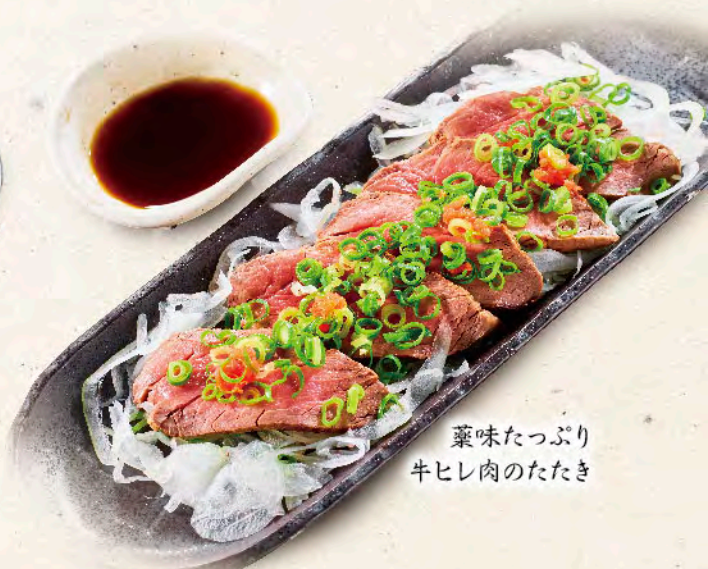
薬味たっぷり 牛ヒレ肉のたたき