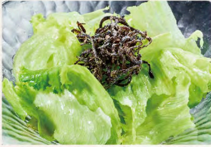
レタスの塩昆布サラダ