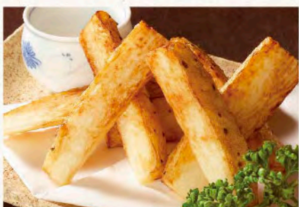
長芋サクサク揚げ