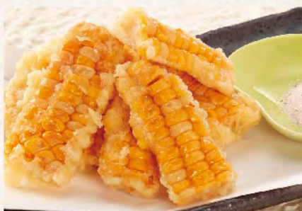
とうもろこしの天ぷら