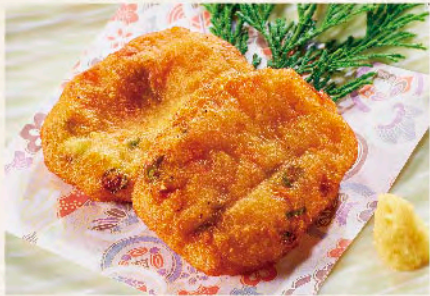
手作りさつま揚げ