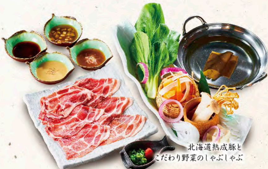
北海道熟成豚と こだわり野菜のしやぶしやぶ