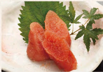
明太子 (あごおとし)