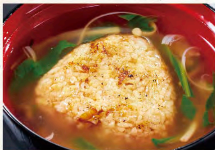
焼きおにぎり茶漬け