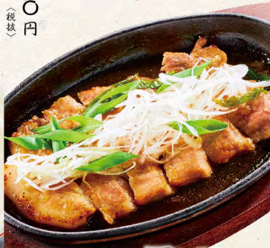
豚肩ロースの 葱わさび焼き