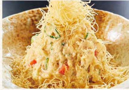
大人のポテトサラダ