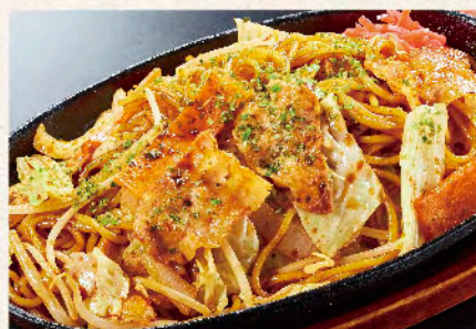
昔ながらのソース焼きそば