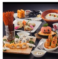
ハロウィンコース ¥3,500~