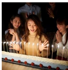
記念日ロングケーキイメージ