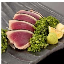
初鯉の塩たたき 599円