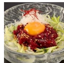
会津馬刺しのユッケ 799円