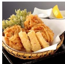
桜海老のかき揚げ と筍の天ぷら 599円