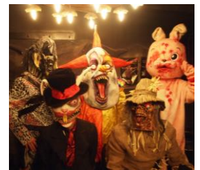
モンスターがサプライズ

そのこだわりは入店時から始まり、光と音の交差する迷路のようなエントランスを抜けた先で、待ち構えていたポリスに手錠を掛けられます。連行されたのは、鉄格子に囲まれた薄暗い監獄個室。この牢獄でお客様には「囚人」として晚餐をして頂きます。灰と黒のボダーの制服に身を包んだ模範囚（ホールスタッフ）の運んでくるピーカーやフラスコ・メスシリンダーに注がれた毒々しい「オリジナル実験カクテル」や、味でもヴィジュアルでもネーミングでも楽しめる「オリジナル演出料理」、記念日には骸骨や十字架を模したケーキにお名前とメッセージを入れてモンスターがお祝いにお邪魔します。