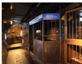
薄暗い地下牢の雰囲気演出