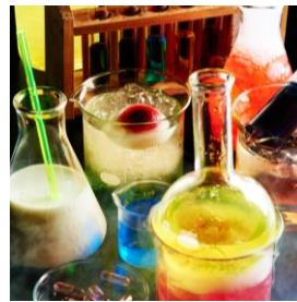
ピーカーやフラスコのカクテル