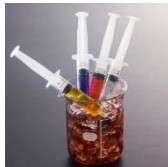
「新薬モニター」 注射器の中身はジン・ウオッカ・ラム・テキーラ。