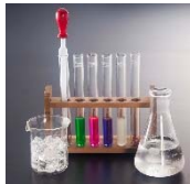
ノンアルコール 「錬金術カクテルセット」 自分好みに調合！ロックアップの定番カクテル