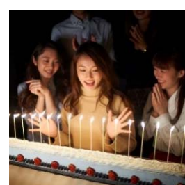
記念日サプライズ承ります