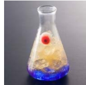
ノンアルコール 「覚醒ナイトメア」 目玉の入ったオレンジ&ミックスベリー。