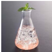
「囚人たちのシャングリラ」 ワインとピーチ、グレープフルーツ使用の爽やかな飲み口