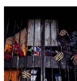
大人気 モンスター襲撃ショー！