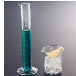
ノンアルコール 「凄惨(せいさん)のカリウム」 クエン酸の効いた酸っぱいカクテル