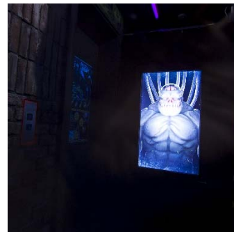
出口で眠るモンスターを起こさないように。帰り口でも容赦のないお見送りが待っています。