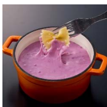
パープル 紅イモフレイバーのポテト系 チーズフォンデュ