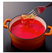
レッド トマトソースフレイバー 系チーズフォンデュ。