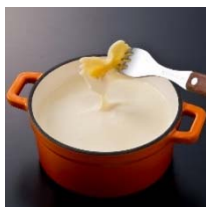
ホワイト 定番！ プレーンチーズフォンデュ