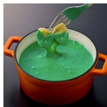
グリーン バジル風味のイタリアン系 チーズフォンデュ。