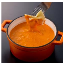
オレンジ トマトとカレーのダブルフレイ バー系チーズフォンデュ