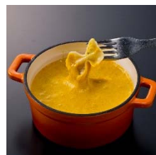
イエロー カレー風味のチーズフ ォンデュ