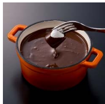
デザート“ブラック” デザートも！チョコレート フォンデュスタイルで。