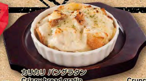
カリカリ パングラタン Crispy bread gratin 香脆焗烤面包