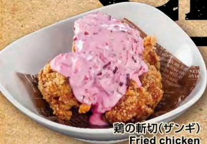
鶏の斬切(ザンギ) Fried chicken 炸鸡块 原味