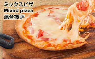
ミックスピザ Mixed pizza 混合披萨