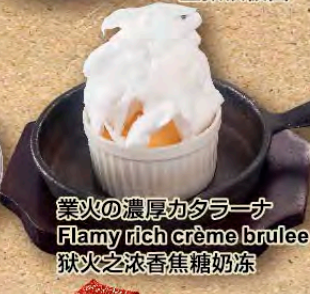
業火の濃厚カスターナ Flamy rich crème brûlée 狱火之浓香焦糖奶冻