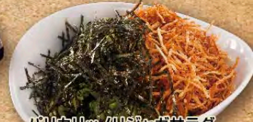
バリカリッノリジャガサラダ Crunchy seaweed and potato salad 香脆海苔马铃薯沙拉