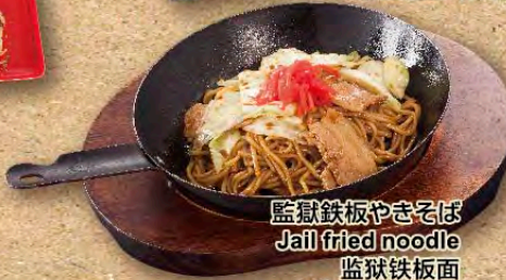
監獄鉄板やきそば Jail fried noodle 监狱铁板面