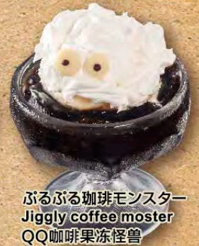
ぶるぶる珈琲モンスター Jiggly coffee monster QQ咖啡果冻怪兽