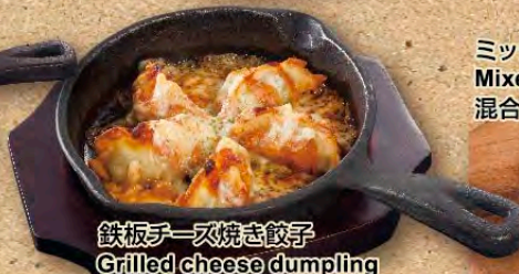
鉄板チーズ焼き餃子 Grilled cheese dumpling 铁板起司煎饺