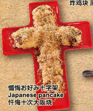
懺悔お好み十字架 Japanese pancake 忏悔十次大阪烧