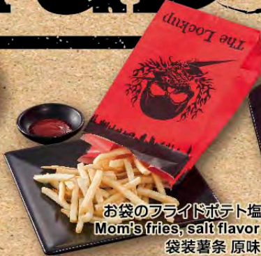
お袋のフライドポテト塩 Momi's fries, salt flavor 袋装薯条 原味