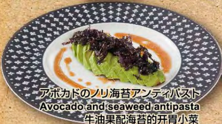
アボカドのノリ海苔アンティパスト Avocado and seaweed antipasta 牛油果配海苔的开胃小菜