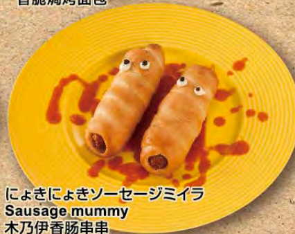
によきによきソーセージミイラ Sausage mummy 木乃伊香肠串串