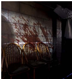
壁には突然、血しぶきが！