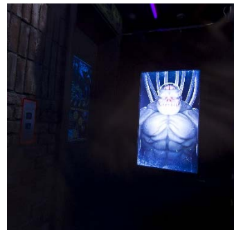
出口で眠るモンスターを起こさないように。帰り口でも容赦のないお見送りが待っています。