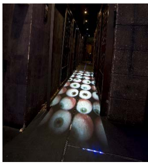
床に広がる無数の目玉を踏みながらお席まで。