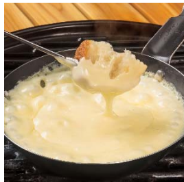
【チケット2枚】 チーズフォンデュ