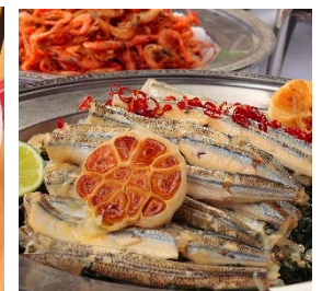
【ビュッフェメニュー】 南知多産 サヨリのオイルサーディン