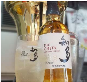
【チケット1枚】 知多ハイボール