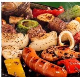
【BBQセット】 お肉、焼き野菜は もちろん食べ放題！