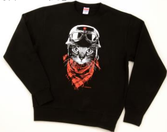
〈スタジオセプト〉トレーナー 5,280円