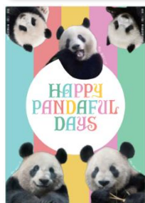
「パンダファミリーオリジナル短冊」

←本館1階・地下1階 食品売場の対象ショップにて、対象商品をお買い上げの方に「パンダファミリーオリジナル短冊」をプレゼント！