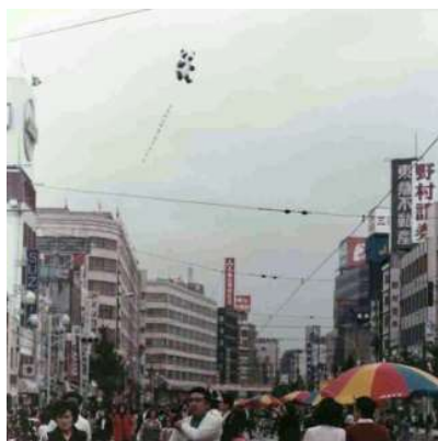
50年前のアドバルーン

50年前、「カンカン」「ランラン」来日時に松坂屋上野店でアドバルーンをあげました。50年後の今年も、上野の上空にパンダのアドバルーンがあがります。