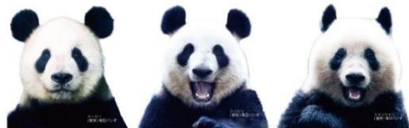
↑「リーリー」「シンシン」「シャンシャン」3枚セット

※各セットはそれぞれ対象売場が異なります。詳しくはHPにてご確認ください。 ※なくなり次第終了。 ※転売は固くお断りしております。