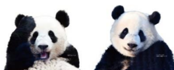
↑「シャオシャオ」「レイレイ」2枚セット