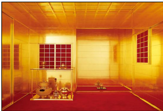
純金箔15000枚を使用した「黄金の茶室」 今回は特別に4億円で販売!!