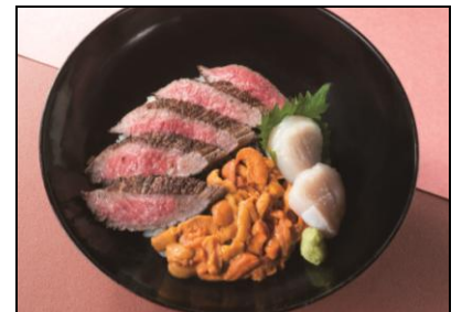
うにがとろける絶品ステーキ丼 3,218円

ウニも食べたい！ステーキも大好き！一緒に食べようと思ってもなかなかできない2つの味を一度に味わえる、そんなわがままなメニューを開発！「朝市食堂 函館ぶっかけ」と「焼肉れすとらん沙蘭」の人気店2店にお願いし、特別に作ってもらった“ ここだけでしか味わえない贅沢コラボめし ”です。