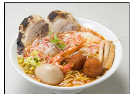
スペシャル海老全員集合 1,383円

旭川で話題のラーメン屋「エースのジョー」が上野店に初出店！甘海老を丸ごとすり鉢でつぶしてとんこつのスープと合わせ、さらに海老油も加えた新味覚ラーメンです。特にオススメしたいメニューは「スペシャル海老全員集合」。海老つみれ・海老ワンタン・海老エキス入り味玉・チャーシューなどなど、丼から溢れんばかりに具材がトッピングされ、まさに海老尽くしの贅沢な一品です。